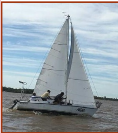
En la foto el "Artax" ganador en la clase H 20

Las posiciones finales luego de computadas las tres regatas fueron las siguientes: